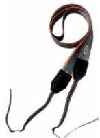
Arnés para el medidor (tipo M1)