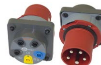
Adaptador AGT para enchufe trifásico 63 A